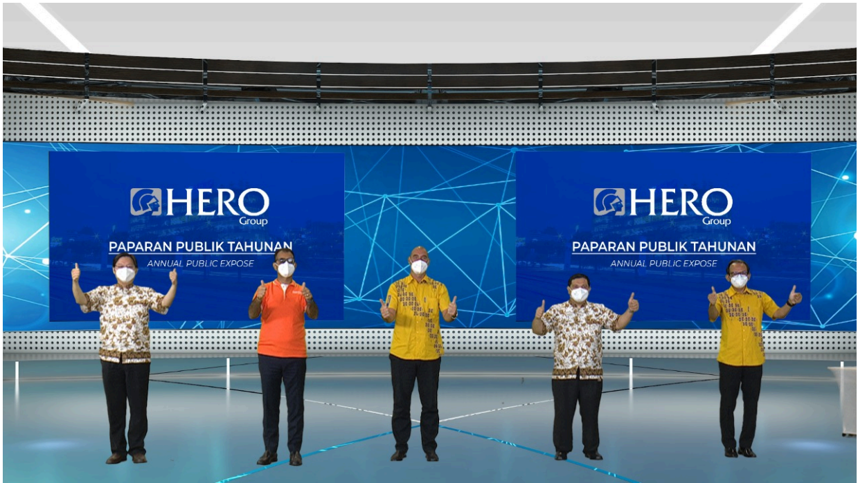
Foto Pelaksanaan Paparan Publik Tahunan PT Hero Supermarket Tbk Photo of PT Hero Supermarket Tbk Annual Public Expose